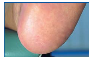
Nach regelmäßiger Pflege mit Callusan EXTRA.